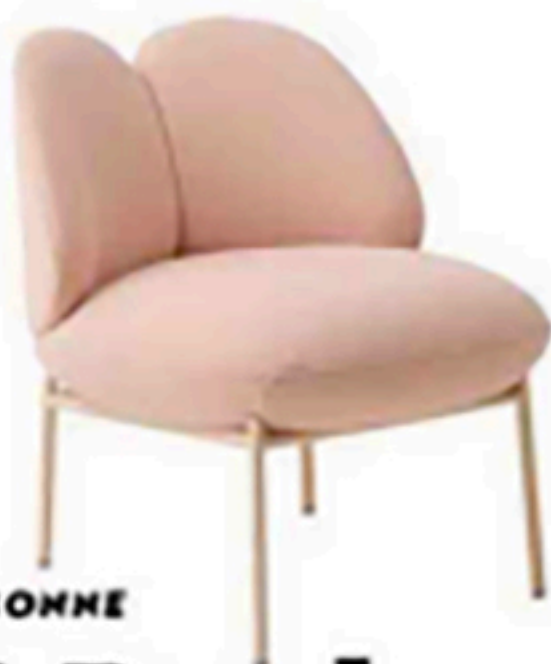
Lampe à poser Table lamp Folio Saint-Louis — Chaise Chair Peter Pan Zaouo