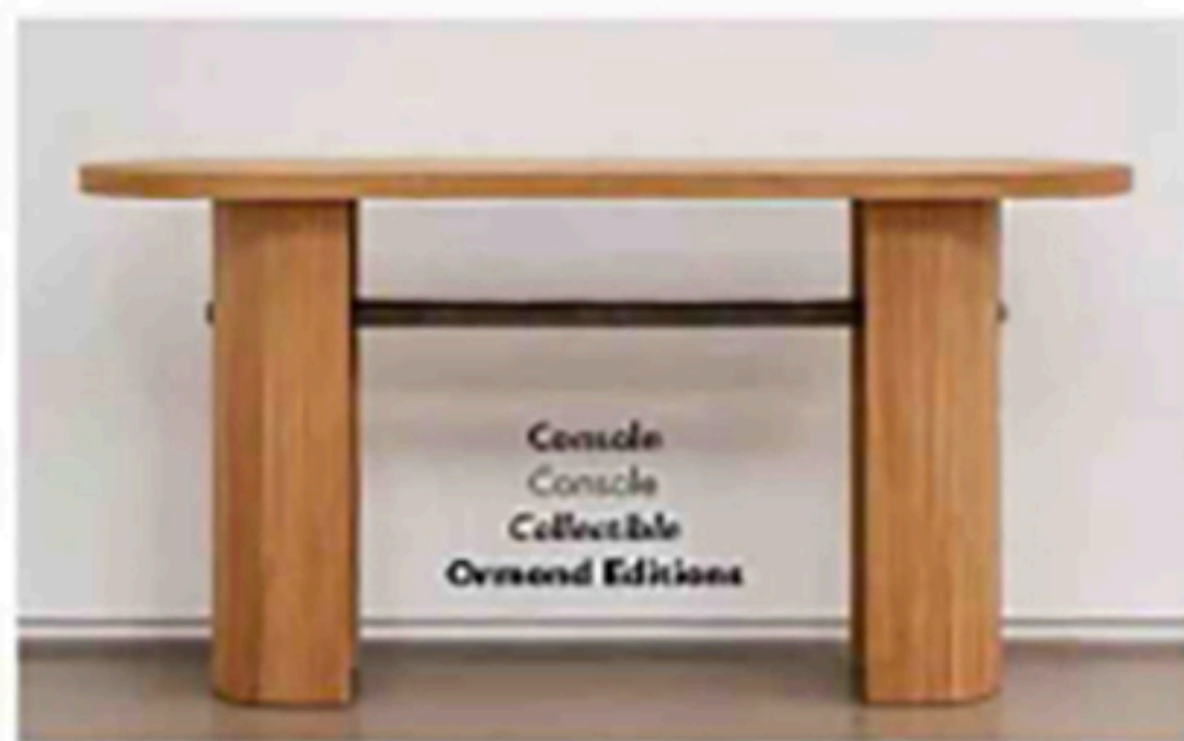
Console Console Collectible Ormond Editions