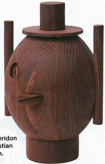
Etagère Cloud des frères Bouroullec, Cappellini. Guéridon Cumulo, Cinna. Chaise Colonne, Pool. Souche, Christian Ghion pour ABR à la Biennale Emergences de Pantin. Sculpture, Jaime Hayon pour Fritz Hansen.